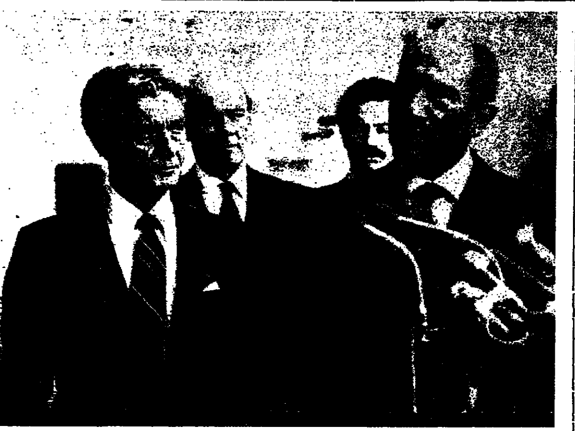
الرئيس السادات بعد اجتماعه بالسيد سول لينوفيتس المبعوث الامريكى لمفاوضات الحكم الذاتي

لندن - تمكن خبراء المتفجرات البريطانيين امس من اكتشاف عبوتين ناسفتين بالقرب من مكتب السياحة الفرنسي في لندن ، وتمكنوا من ابطال مفعولهما . وقد علم على هاتين العبوتين في أعقاب وكالة هاتية اجراها مجهول مع مكتب وكلة انباء نيوايبيرس ادعى مسؤوليته حركة الثلث من أكتوبر من وضع القابل ويذكر ان حركة الثلث من أكتوبر هي حركة ارمية اذعت مسؤوليتها عن عدد من الهجمات تعرضت لها مكاتب سياحة وكهران سويسرية في كل من روما وبيروت وباريس وجنيف .